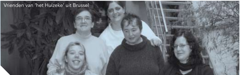
Vrienden van 'het Huizeke' uit Brussel